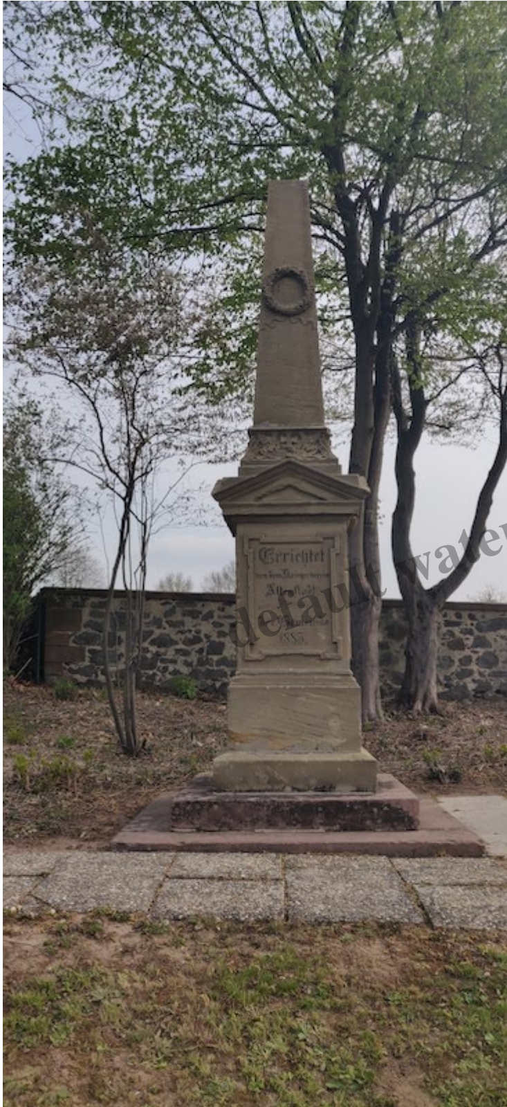
Das Denkmal für die Soldaten von 1870/71 in Altenstadt (Hessen)