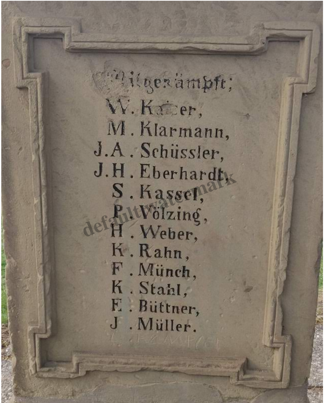
Die Altenstädter Soldaten von 1870/71