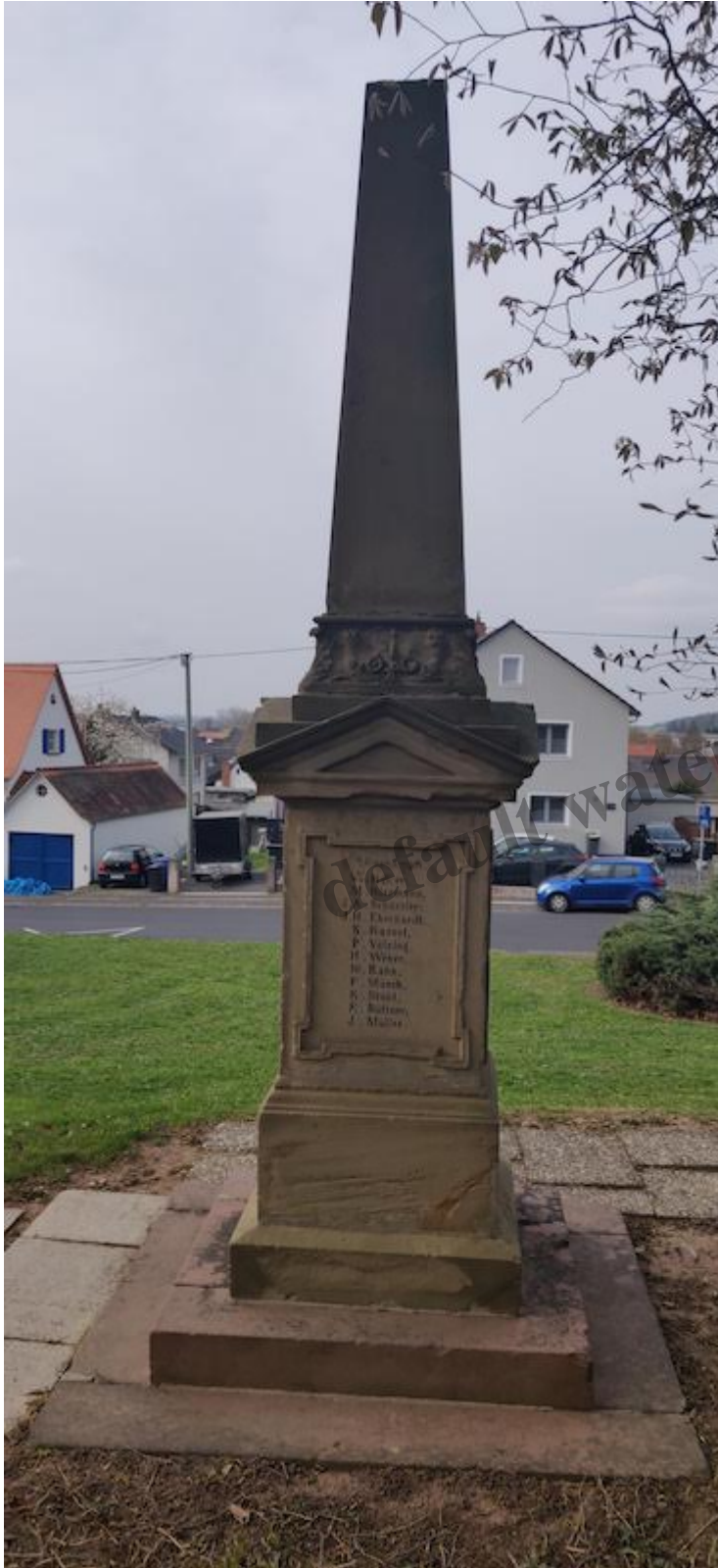
Das Denkmal für die Soldaten von 1870/71 in Altenstadt (Hessen)