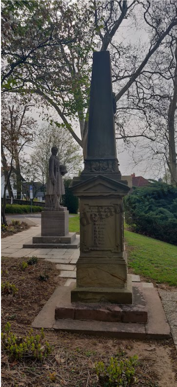
Das Denkmal für die Soldaten von 1870/71 in Altenstadt (Hessen)