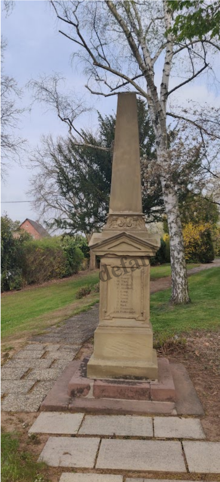
Das Denkmal für die Soldaten von 1870/71 in Altenstadt (Hessen)