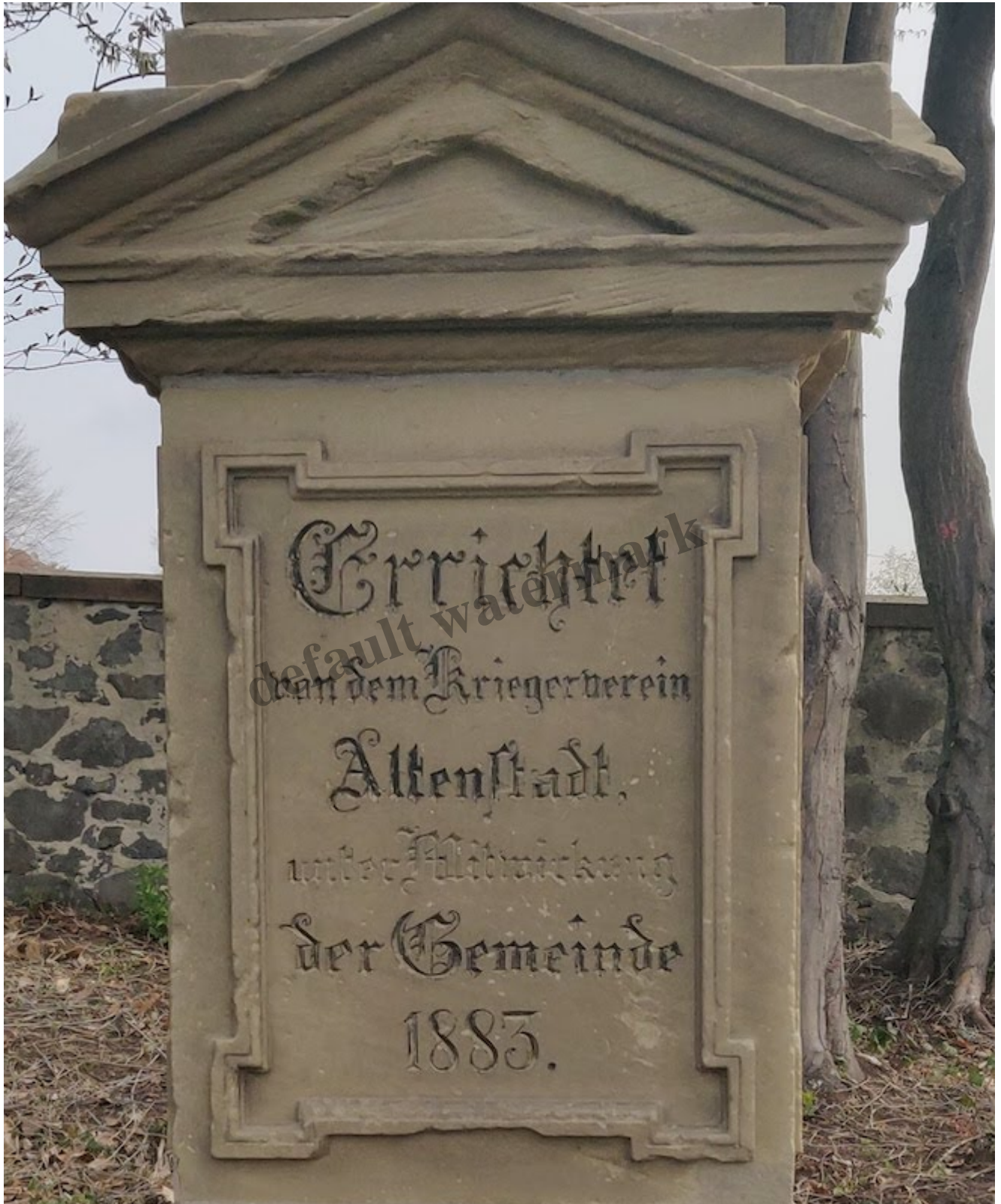
Die Widmungsinschrift des Denkmals von Altenstadt