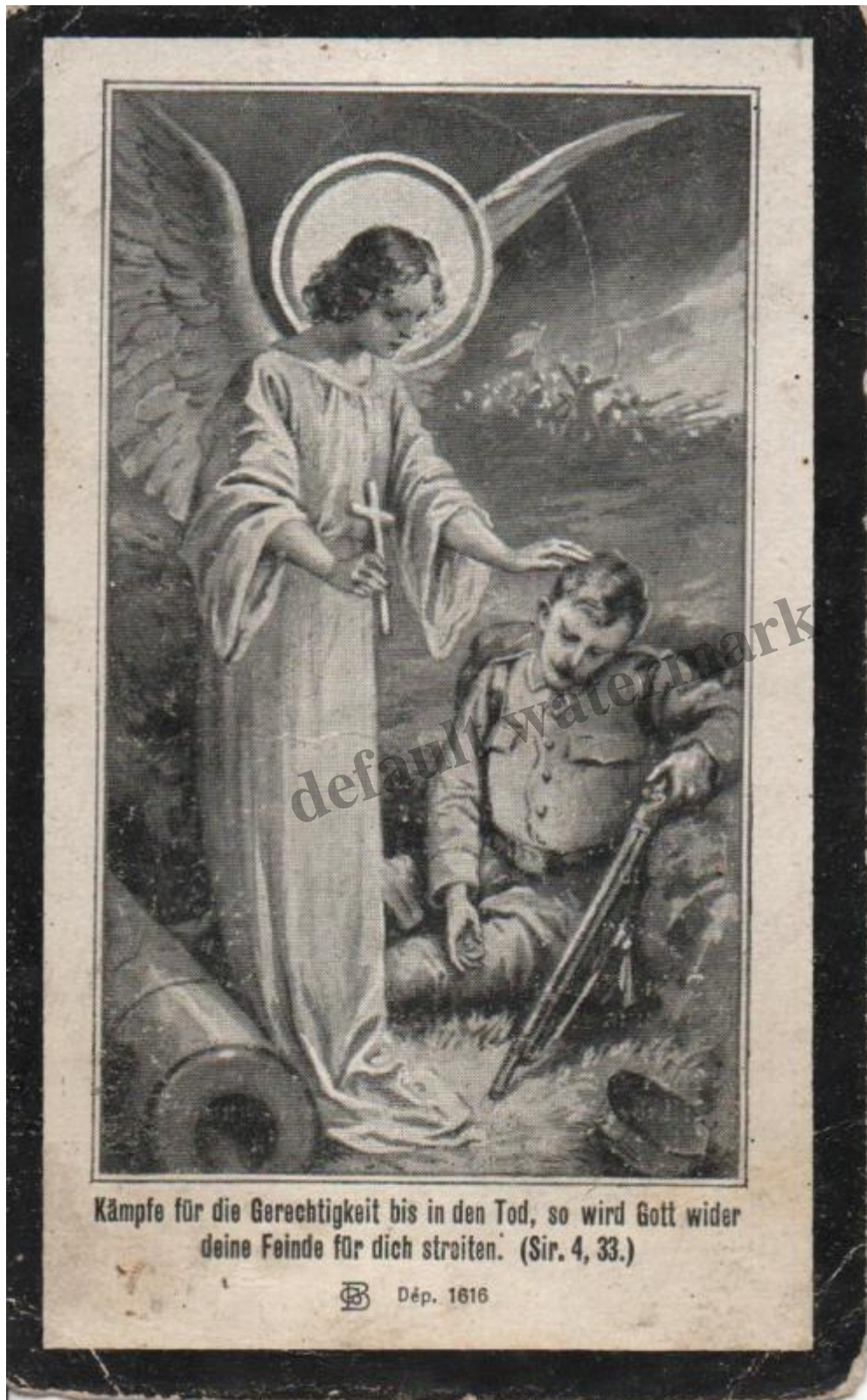
Rückseite des Sterbebildes von Kaspar Hefter