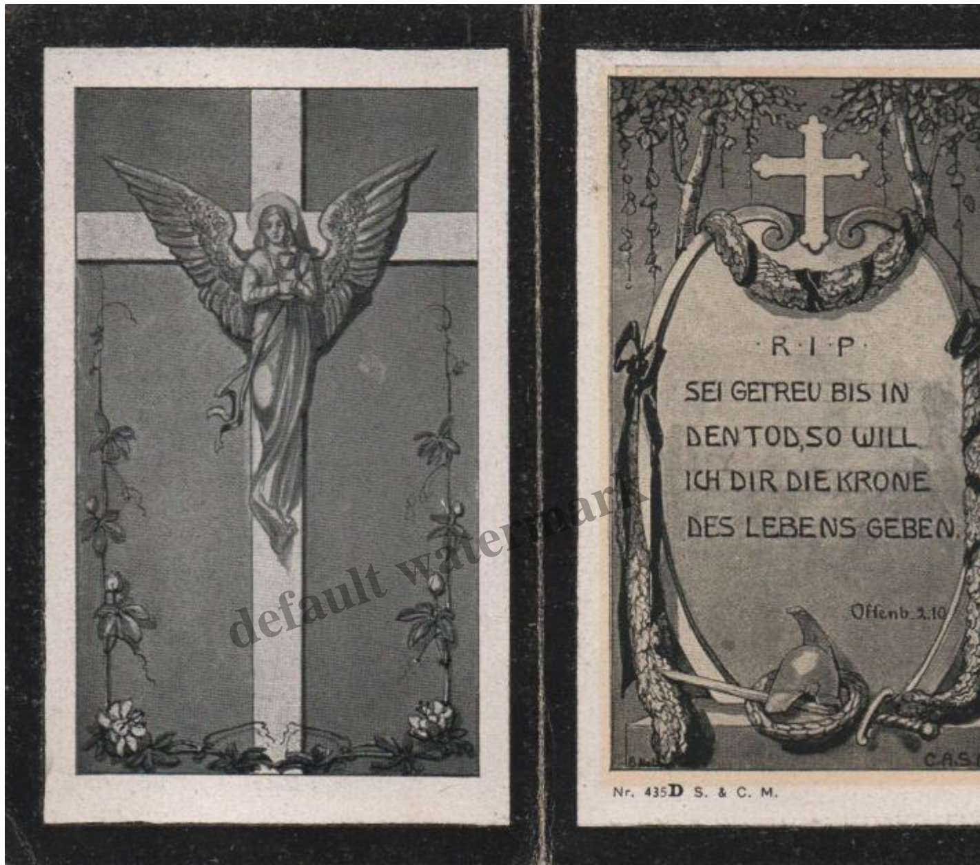
Rückseite des Sterbebildes von Rudolf Zahrer